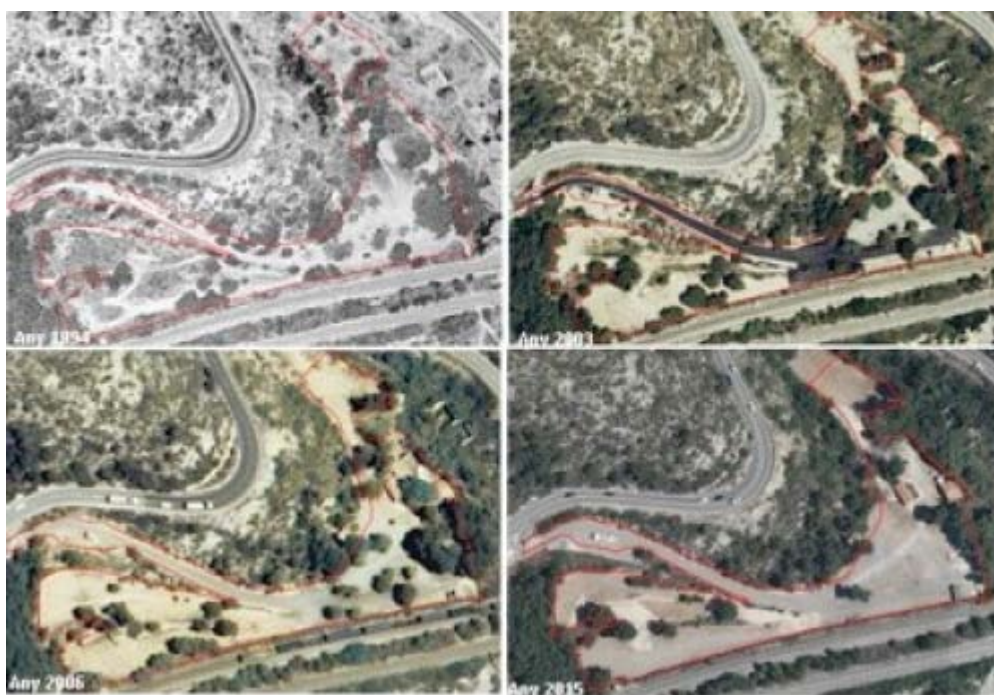
Imatge 1. Ortofotomapes de l'àmbit els anys 1994, 2003, 2006 i 2015

Tot i aquesta mancança, a continuació es valora l'estat actual de l'aparcament, analitzant-ne l'impacte derivat, mitjançant una anàlisi diacrònica de l'àmbit d'estudi a partir dels ortofotomapes històrics disponibles en aquests Serveis Territorials i de les fotografies facilitades pels propietaris, les quals mostren l'àmbit d'estudi als anys noranta.